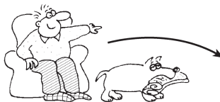
Take the newspaper.

brim 2 /brɪm/ verb [I] ( brimming ; brimmed ) brim (with sth) színültig tele van (vmivel): His eyes were brimming with tears (könnyben úszott).