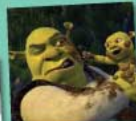
5 Shrek le Troisième