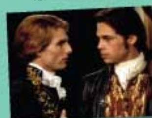
6 Entretien avec un vampire

beau/belle mince grand/grande drôle naturel/naturelle romantique amusant/amusante sympa intelligent/intelligente talentueux/talentueuse