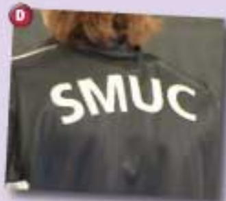
C'est Stade Marseillais Universitaire Club.