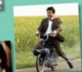
7 Mr Bean