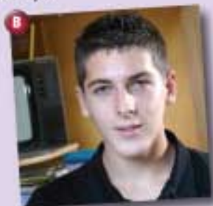
Des fois je parle anglais quand je joue au basket mais pas souvent.