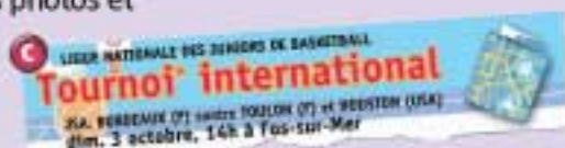
Tu joues au basket en Ligue Nationale des Juniors?