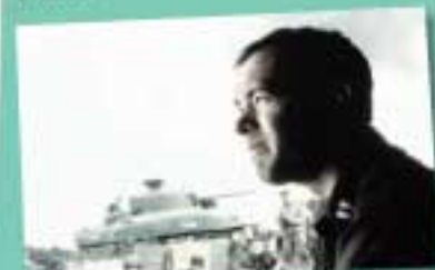
1 Il faut sauver le soldat Ryan