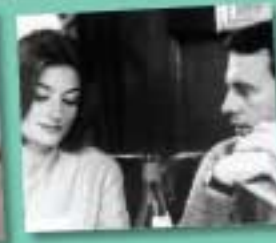
4 Un homme et une femme