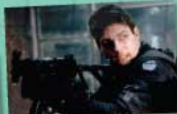
2 Mission Impossible 3