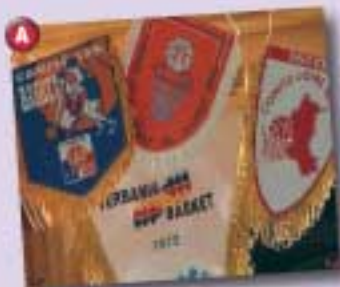
Non, je joue au basket en Ligue de Championnat de France, en Cadets Division 2.