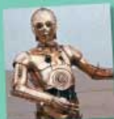
3 La Guerre des Étoiles